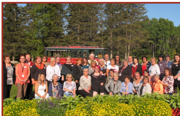
Participants et organisateurs 2017 - 20ème édition

Veillez joindre votre paiement avec cette fiche d'inscription