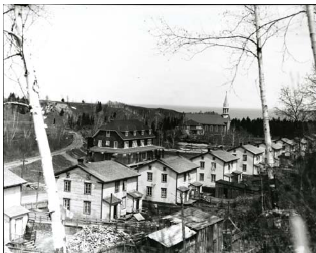
ANQC, SHS #2026 (Chabot)